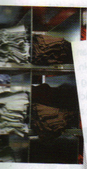
SHIRT: Spreadshirt hat stets... Die Motive werden... bereitet, ehe sie mit... esse wandern.